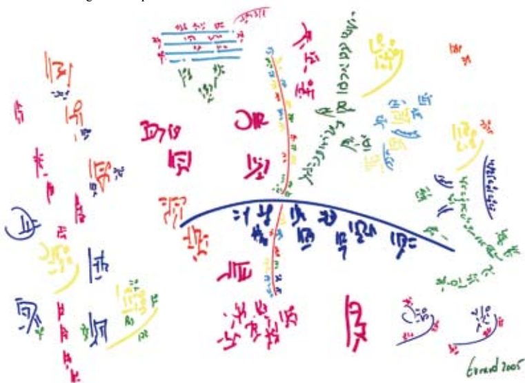
Das unendliche Möglichkeitspektrum

des Chaos-Vektors reduzieren, da beide Vektoren sich substituiv zueinander verhalten. Im Idealfall ist G = k und C = 0 . Hierzu zitiert die Bibel: Wahrer Glaube kann Berge versetzen. Auf diese Art und Weise sind wir in der Lage, die Bewegungsbahn unserer Ich-Kontinuität zu beeinflussen. Wir können entweder stark dirigieren durch einen hohen G -Vektor oder uns in der Unendlichkeit von Möglichkeiten treiben lassen durch einen hohen C -Vektor.